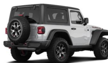
Plastic & Trim

Powłoka ceramiczna XPEL FUSION PLUS PLASTIC & TRIM ułatwia ochronę tworzyw sztucznych i materiałów wykończenia pojazdów. Wszystko zaprojektowane, aby zapewnić lata ochrony.